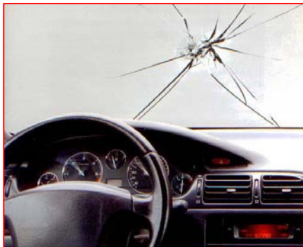
Registerbild Auto Glas